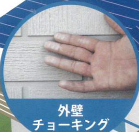
外壁 チョーキング